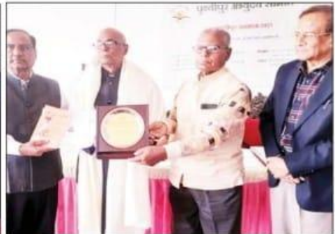
अतिथियों के हाथों सम्मान प्राप्त करते विभिन्न क्षेत्रों के लोग।